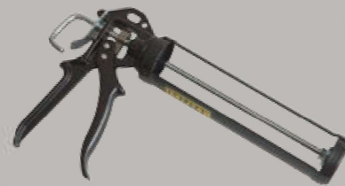
Applicateur de colle