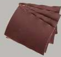
Papier abrasif à grain fin