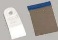
Spatule en caoutchouc, en métal