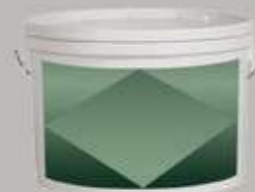
Mastic hydrosoluble à grain fin