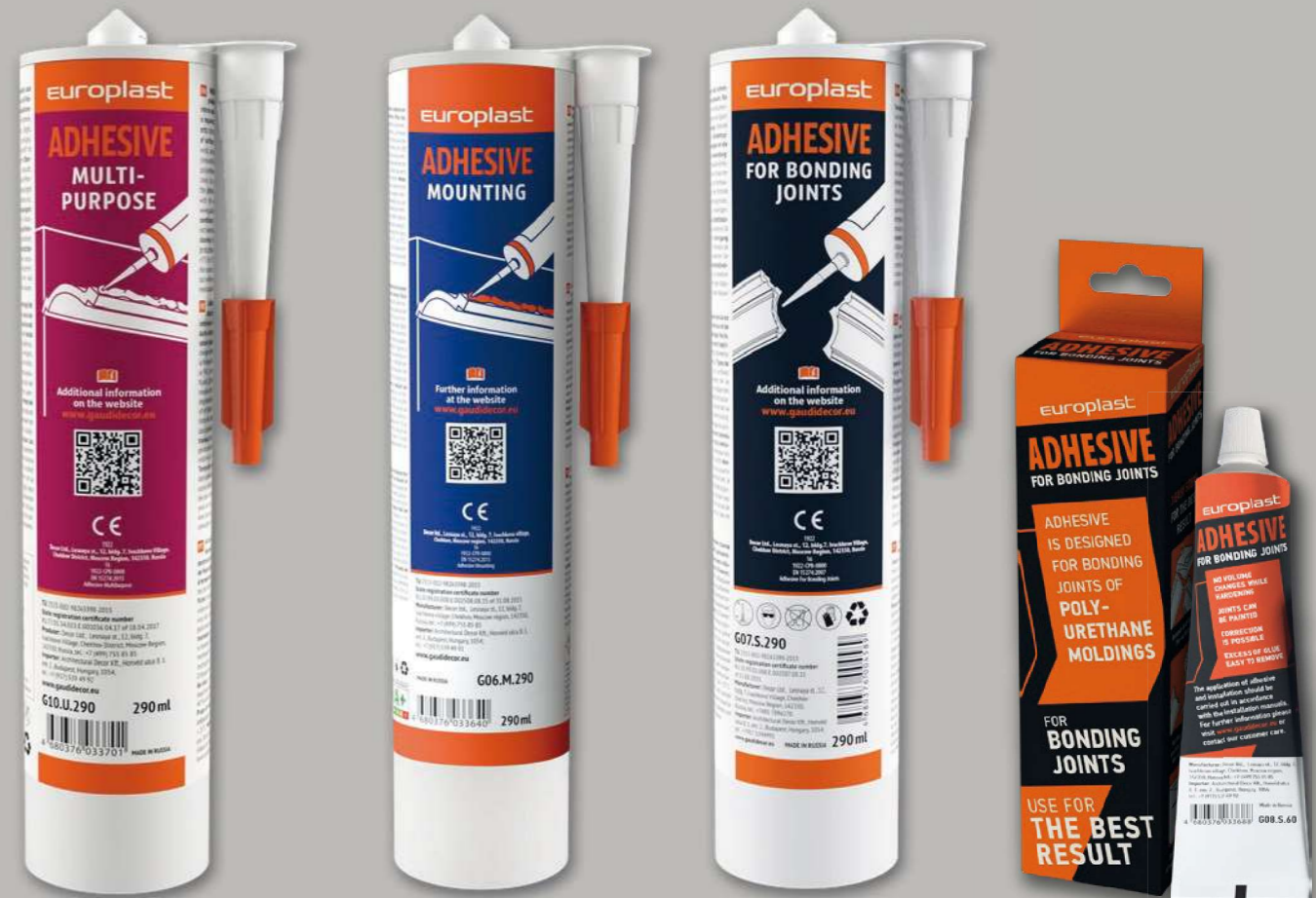
G10U290 290 ml